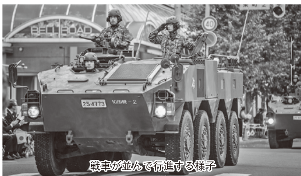
戦車が並んで行進する様子