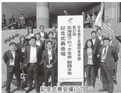
記念式典会場にて

九月二十七日・二十八日の二日間、「日本商工会議所青年部 第三十七回北海道ブロック大会」が釧路市で開催され、当青年部からはメンバー十四名が参加致しました。 今回の釧路大会は「覽古考新くしろのちから」を開催地テーマに、道内二十四の青年部、道外からも九十五の青年部が集まり、釧路市内各地で記念式典や各種分科会、大懇親会等が開催されました。 参加者らは釧路の自然や街並みに触れ、研鑽や交流で連携を深め今後の活動を更に前進させていく有意義な時間を過ごしました。