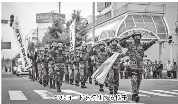
ベルロードを行進する様子

また、昨年に引き続きグルメまつりが開催され、キッチンカーや各飲食店九店舗が出店、周りには自衛隊車両の機動戦闘車や装甲車が展示され来場者を楽しませていました。