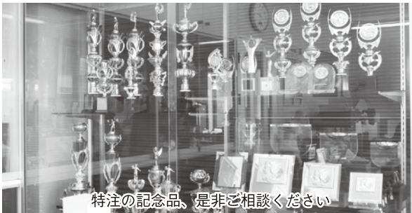
特注の記念品、是非ご相談ください

最後に、新しい視点や考え方、自分のアイデアに自信をもつことを大切にしていきたいとお話して下さいました。