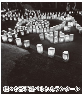
様々な形に並べられたランターン