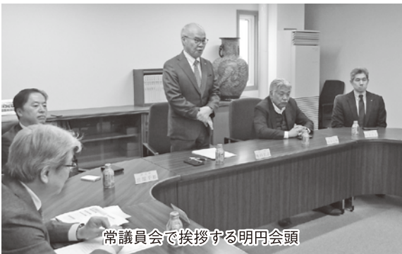
常議員会で挨拶する明円会頭