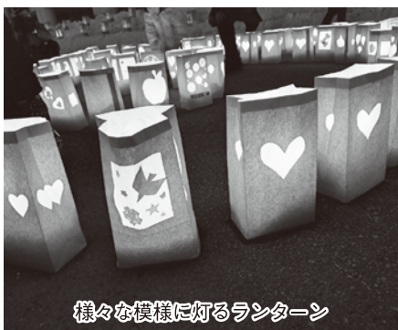
様々な模様に灯るランターン