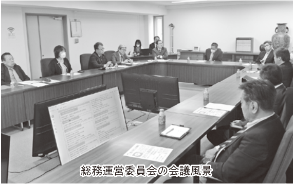
総務運営委員会の会議風景