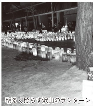
明るく照らす沢山のランターン