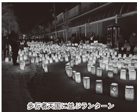
歩行者天国に並ぶランターン