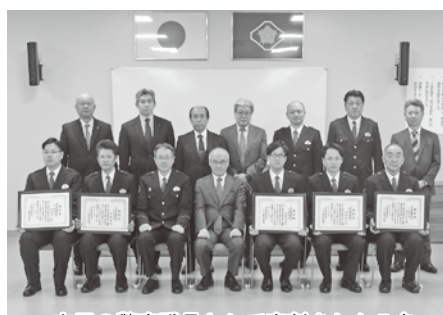
市民の警察職員として表彰された5名