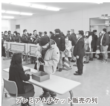
プレミアムチケット販売の列

一万円で一万二千円分使用出来る20%のプレミアムを付けた「滝川市飲食店応援プレミアムチケット」を二月四日から販売しました。販売初日の日曜日は約二千八百セットが売れ、その後、約一カ月で五千セットすべてが完売しました。 この事業はエネルギー・食料品価格等の物価高騰の影響を踏まえ、市内における消費の回復及び拡大を図り、市内飲食業者を支援することを目的として実施するものです。 より多くの飲食店で使えるよ