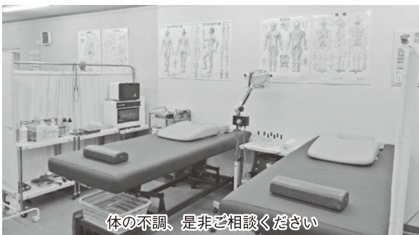
体の不調、是非ご相談ください

鍼灸セットの治療時間は45分ほど。慢性的な治療にはかかりつけ医師の同意があれば保険も適用されます。「副作用も痛みもないので、心身ともに不調を感じる方は是非治療を受けてみてほしい。」とお話して下さいました。