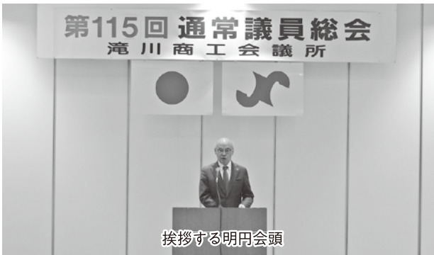
挨拶する明円会頭