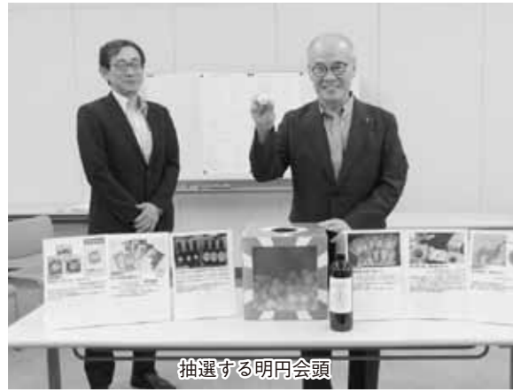
抽選する明円会頭

本年五月二十日から六月二十八日まで、「会議所共済加入増強キャンペーン」を実施しました。 今回のキャンペーンは、前回の令和元年から五年ぶりの実施で、期間中に一口以上の新規加入や増口加入など、ご成約をいただいた事業所に口数に応じた記念品を呈したほか、抽選で当所で行ったギフトセレクション(夏号)のうち指定した商品からお好きなものを十名様、また、アクサワイン一本を十名様に記念品としてプレゼント