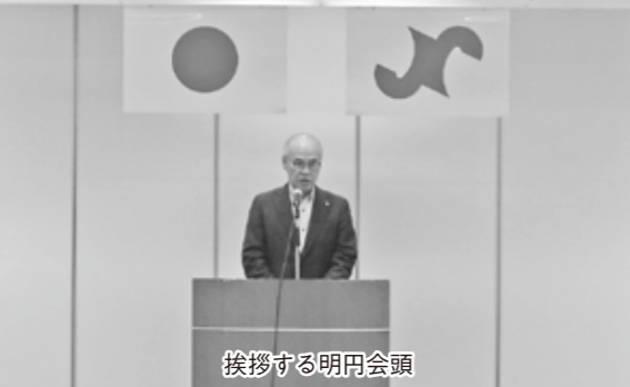
挨拶する明円会頭