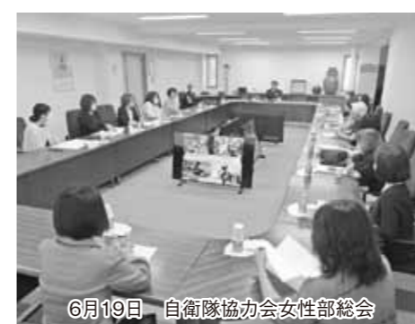
6月19日 自衛隊協力会女性部総会

総会終了後、中空知青色申告会連合会では、定額減税制度の講演会、自衛隊退職者雇用協議会では、退職自衛官の概況説明、滝川自衛隊協力会女性部では、陸上自衛隊滝川駐屯地司令の講演会を実施しました。