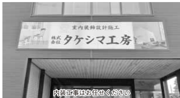
内装工事はお任せください

壁紙や床でお部屋の雰囲気大きく変えることができます。内装の事は是非ご相談ください。